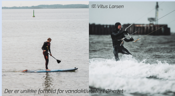
Der er unikke forhold for vandaktiviteter i Øhavet

Langelands kyster og det lavvandede øhav giver unikke forhold for vandaktiviteter som havkajak, SUP og surf. Se mere om projektet SHORES Langeland på modsatte side.