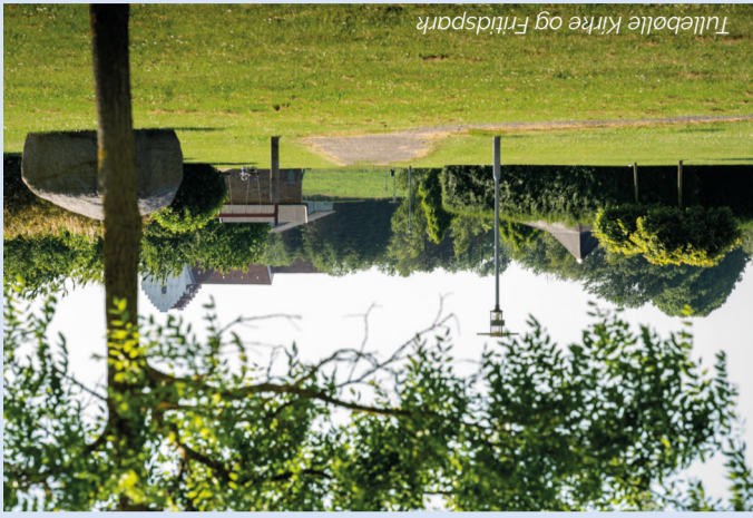
Tullebølle Kirke og Fritidspark

Tullebølle Kirke er en af de smukkeste af Danmarks mange middelalderlige kirker fra 1400-tallet. På tårnet står 1830 under et kronet monogram. Det var Tranekærs ejer, der havde købt sig ind som medejer ved en restaurering.