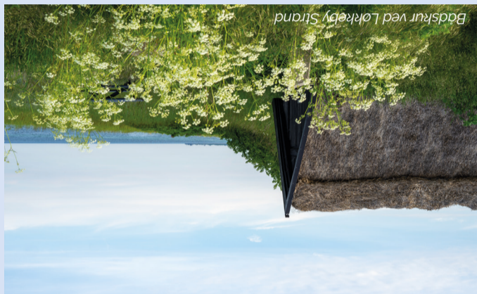
Badskur ved Løkreby Strand

Turen mod syd langs stranden krydres af store skibe, der følger den snørkede dybvandsrute tæt på kysten. 25.000 skibe passerer Langelandsbæltet hvert år – på vej til eller fra verdens største brakvandshavn, Østersøen. De store færger fra Kiel til Oslo eller Göteborg er et imponerende syn.