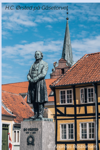
H.C. Ørsted på Gåsetorvet

Rudkøbing er Langelands eneste købstad, anlagt allerede i 1100-tallet. Byen har, som det er almindeligt, to torve: Gåsetorvet og Torvet. Ved Torvet ligger det gamle rådhus, som i dag er flot restaureret og bruges til sognehus.