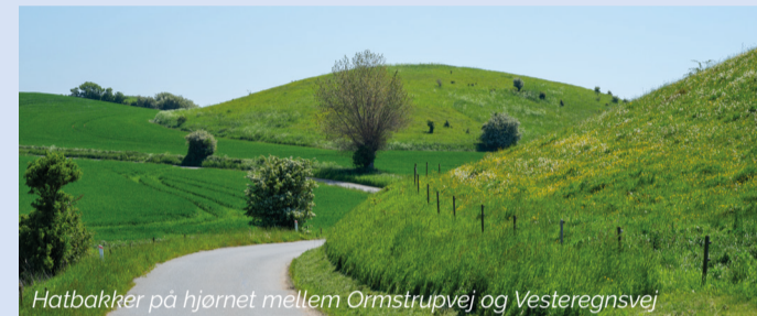
Hatbakker på hjørnet mellem Ormstrupvej og Vesteregnsvej

Dæmningen mellem Henninge Nor og Lindelse Nor er ikke en del af Øhavsstien, men stien fortsætter et lille stykke på den anden side af dæmningen og er der forbundet med Klæso Natursti. Følg Naturbeskyttelseslovens regler har man ret til at krydse dæmningen til fods. Ved Klæso er der mulighed for parkering.