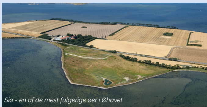
Sjø - en af de mest fulgerige øer i Øhavet